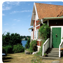
DOMICILE «SANS FIL»