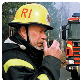
SAUVETAGE ET SECURITE