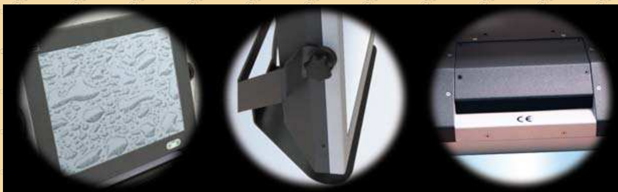
ÉTANCHE IP-65 FACE AVANT