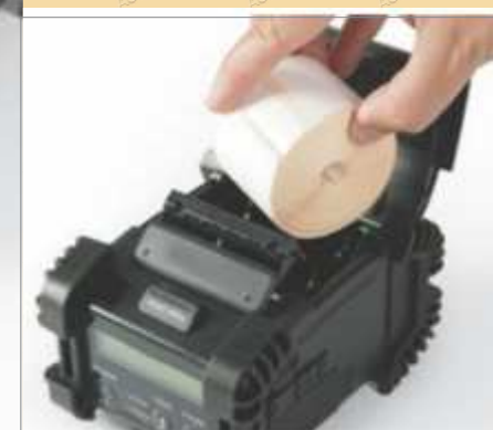
Une des meilleures capacités média du marché