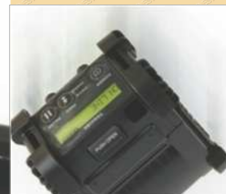
Robuste et résistante, elle supporte des chutes sur le béton de 1.8 mètre (1.5 mètre pour la AG-MP4)