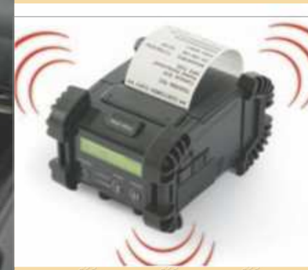
Certifiée Wi-Fi (modèle AG-MPx-WL)